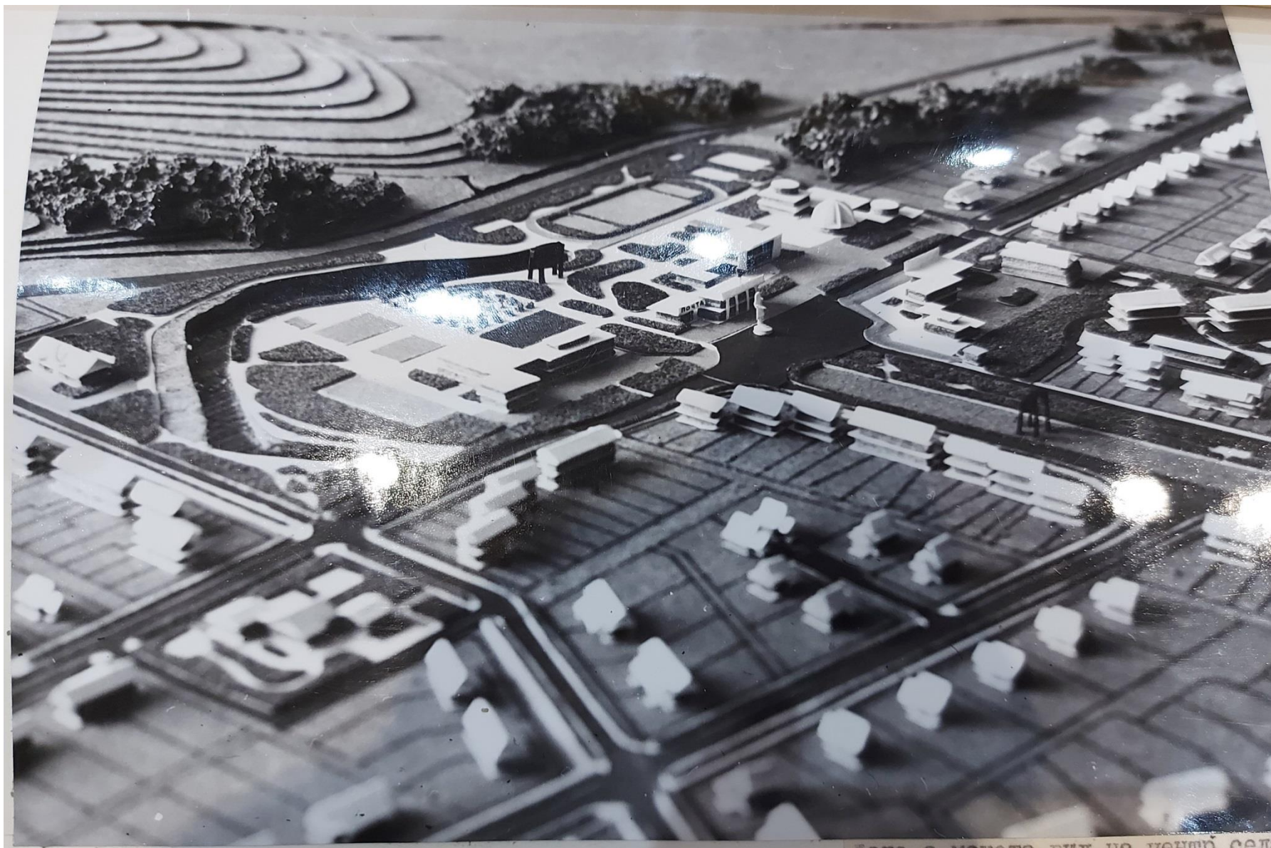
Вид на моделот рин на центро село